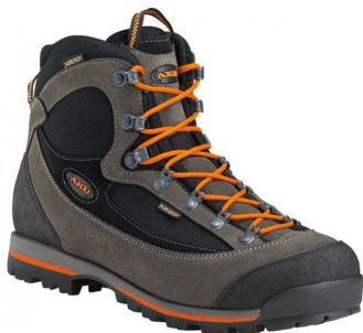
Vhodná kotníková bota.

boty - na výpravy, kde se jde s těžším batohem, je dobré mít kotníkové boty - pohorky.