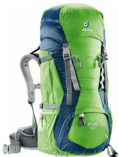
Batoh? Třeba takový.

krojovka - krojová košile, která se využívá na táboře a při slavnostním ohni (Srazy). Barva by měla být