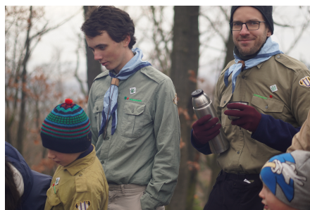
Na přesném odstínu nezáleží...

oddílové tričko - pruhované "námořnické" tričko. Jeho pořízení ani nošení určitě není povinné,